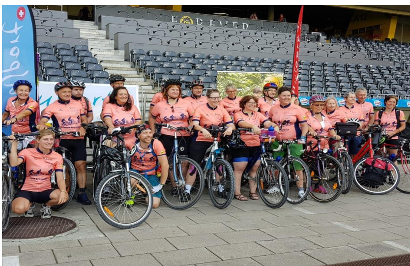
Ankunft der «Tour de Courage» im Stade de Suisse, Bern